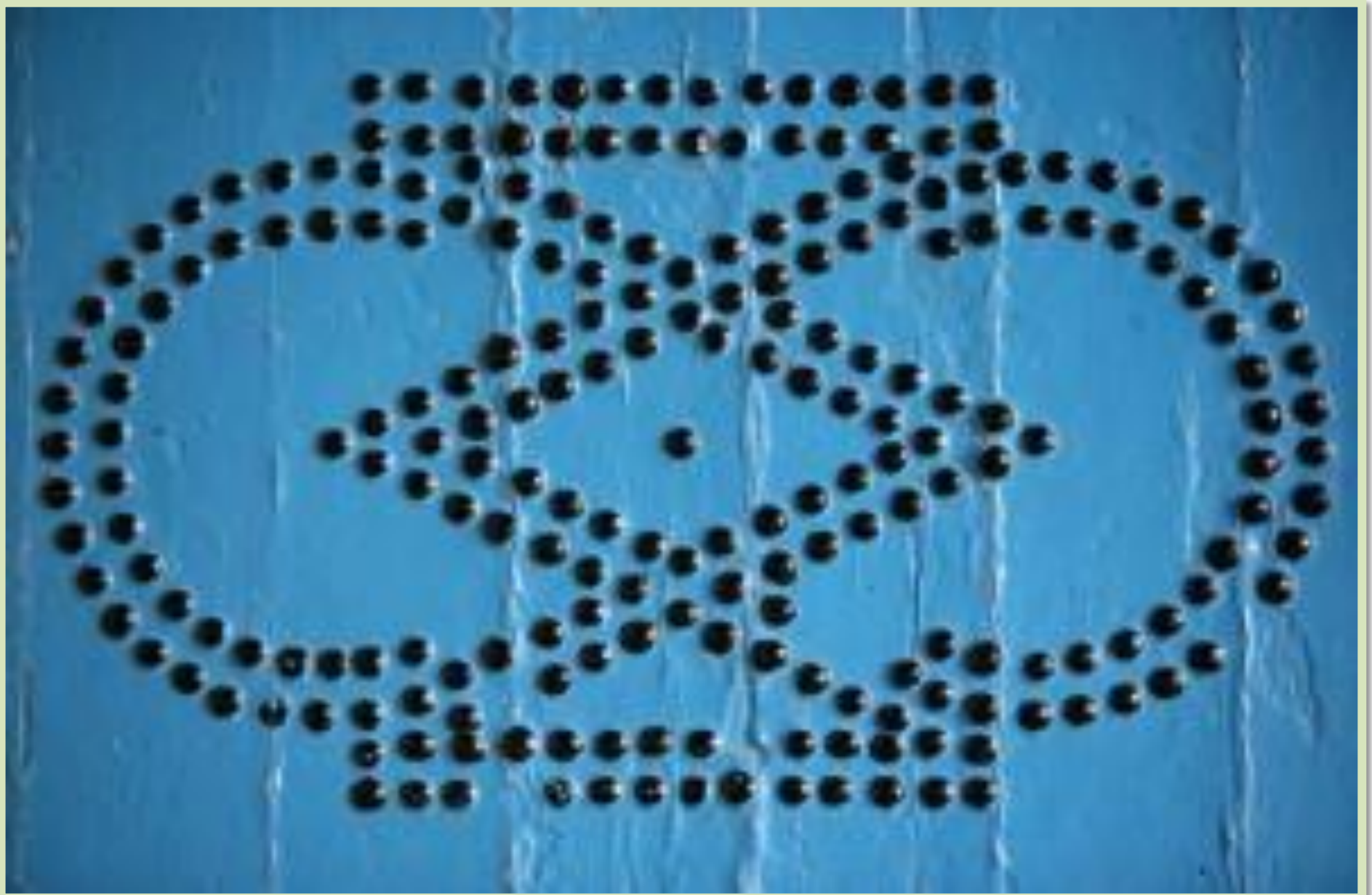
Porte cloutée, Tunisie